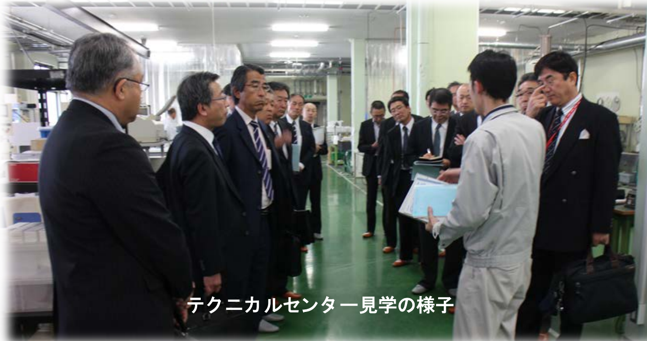
テクニカルセンター見学の様子

午後からは、長年の研磨技術で培ったノウハウを新しいビジネスモデルとして構築した仙北郡美郷町にある(株)斎藤光学製作所を訪問した。