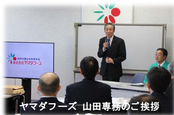
ヤマダフーズ 山田専務のご挨拶

工場内は整然としており、安全安心な食品の提供に向けて細心の注意を払い衛生面には万全を尽くしている様子が伺われた。