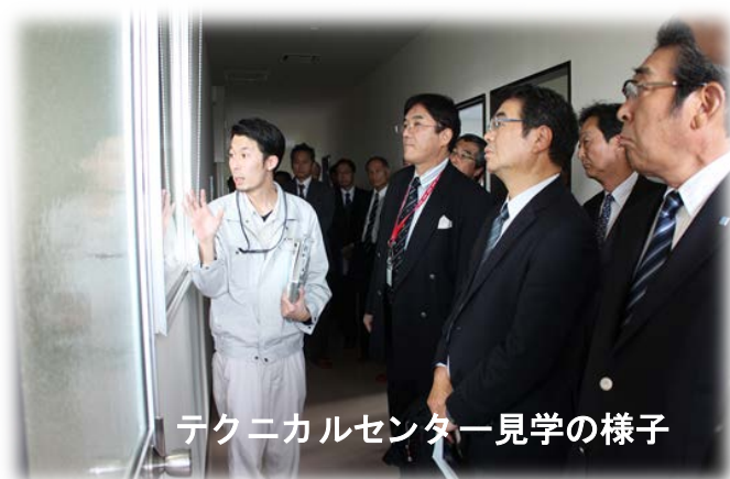
テクニカルセンター見学の様子