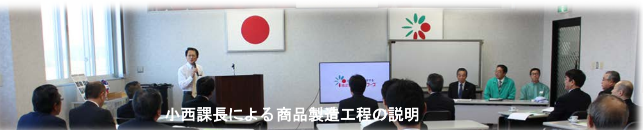
小西課長による商品製造工程の説明