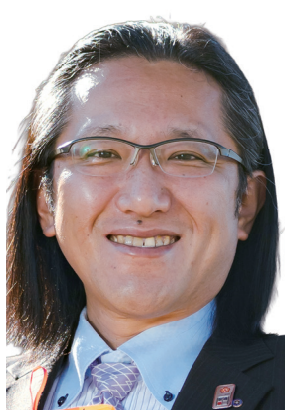
パネルディスカッション 登壇者