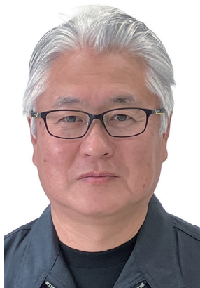
パネルディスカッション 登壇者