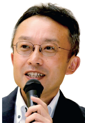
パネルディスカッション ファシリテーター