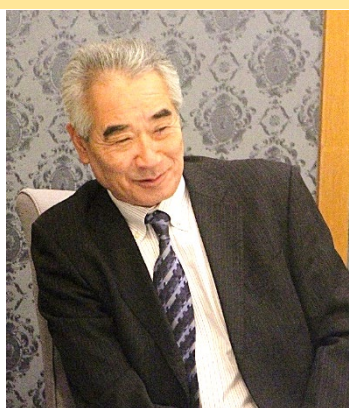
立田企画運営委員長