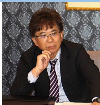
柳沼企画運営委員長